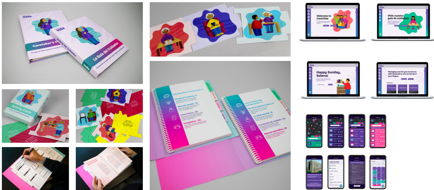
Fig. 6. Examples of CareVida's design system. Moving anti-clockwise: Website for caretaker task management; Printed care guide to help with appointments, medication management and routine planning; Activity cards to build a daily routine; Companion mobile app for caretaker task management.